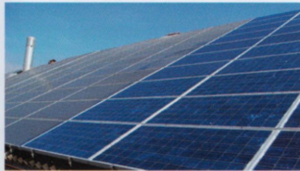
links: Vor der Reinigung rechts: Nach der Reinigung

Verschmutzte Anlagen können innerhalb weniger Jahre bis zu 30% ihrer Leistung verlieren. Durch eine fachgerechte Reinigung beugen Sie irreparable Schäden an Ihren Modulen vor und sichern sich dauerhaft hohe Erträge.